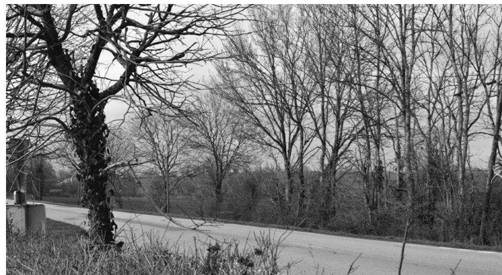
Etat projeté avec esquisse